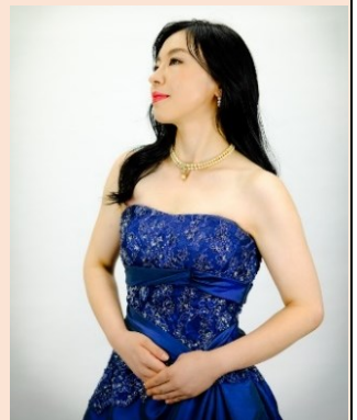
普段とのギャップをお愉しみ頂ければ幸いです